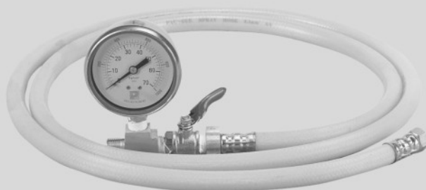
TESTOVACÍ TLAKOVÝ SET (manometr, ventil a vysokotlaká hadice délky 1,8 m).